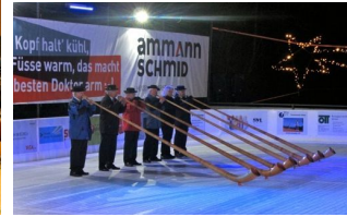
Eröffnungsfeier „Uster on Ice“