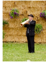
Eidgenössisches Jodlerfest Davos 2014 Trio Malika und die Gruppe Oberuster