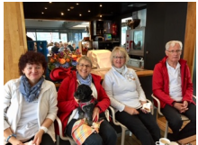
2018: 55 Jahre Alphorngruppe Uster Ausflug auf den Pilatus