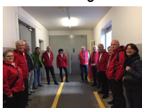
2019: Ausflug zu Victorinox