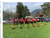
2019: NOSJV-Wettblasen Buchs SG im April